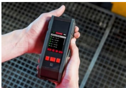
MESSERGEBNIS AM SENSOR